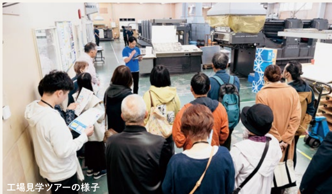
工場見学ツアーの様子

東区オープンファクトリーは、若年層へ地域の企業への就職を考慮してもらうため企業を知ってもらうこと、「産業のまち」東区の魅力を発信し、にぎわいを創出することを目的としています。昨年に続き2回目の開催となった今回は、参加企業が11社から21社に増え、まさに「東区」オープンファクトリーと呼ぶにふさわしいイベントになりました。