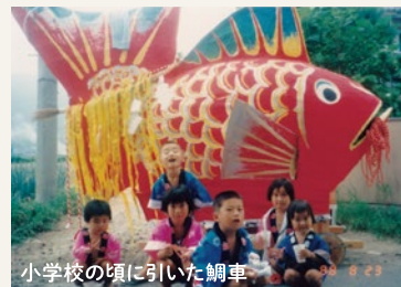
小学校の頃に引いた鯛車