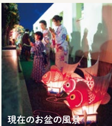
現在のお盆の風景