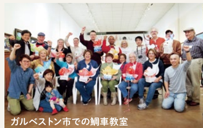
ガルベトン市での鯛車教室