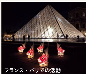
フランス・パリでの活動