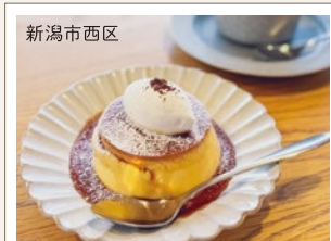
新潟市西区 プリン TOCONOMA Barber Cafe Gift むっちり固めでボリューム満点プリン。 優しい甘みのカフェラテもおすすめ。