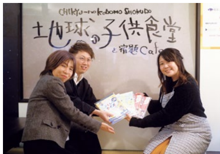
スタッフの方へカレンダーをお届けしてきました

NPO法人 Lily&Marry'S 新潟の魅力を発信し、地域と人を元気にしていくことをコンセプトに活動する団体。2021年より「地球の子供食堂と宿題Cafe」古町店を運営する。子どもたちがワクワク楽しく来られる第三の居場所をコンセプトに毎日開設。登録人数は300人を超え、食事や居場所として1日平均10~15人程が利用している。 ▼詳細はこちらをご覧ください。 npolilymarrys.wixsite.com/kodomosyokudou