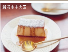
新潟市中央区 イタリアンプリン 編むと紡ぐ 固めプリンの王道。時期によって変わる プロローグコーヒーとの相性も抜群。