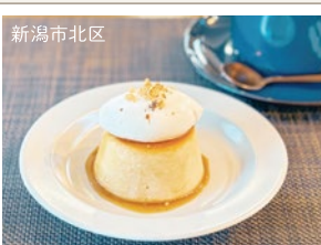
新潟市北区 しるきーもプリン カフェヤドリギ ねっとりもったり濃厚おいもプリン。ドリップ がサイフォンで選べるコーヒーも魅力。